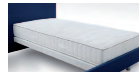
Einlegebeispiel Selecta UP11-N