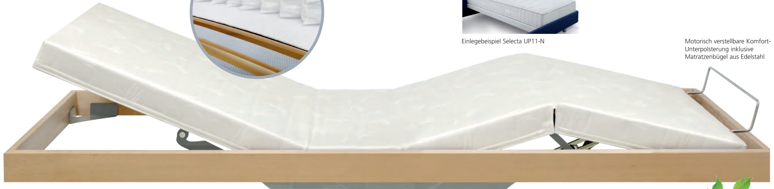
Für noch mehr Komfort: Selecta UP11 2-Matic